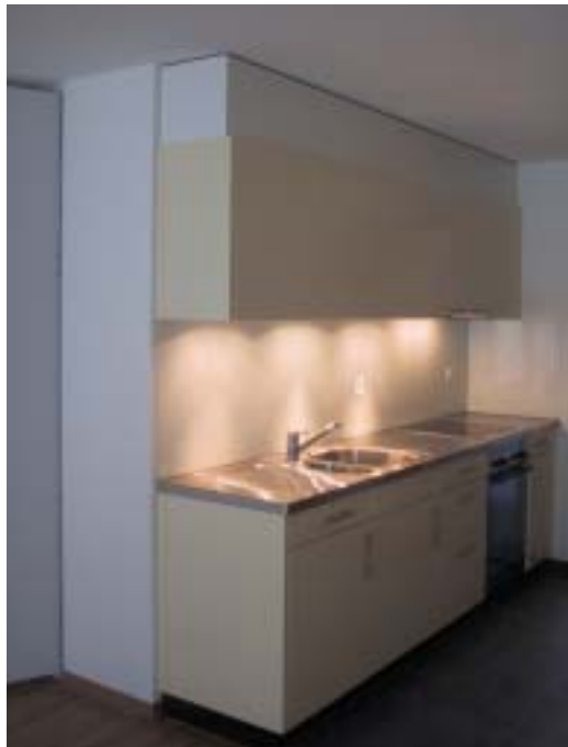
Teilansicht Küche der 2 1/2-Zimmer-Etagenwohnung