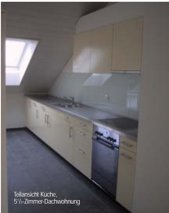
Teilansicht Küche, 5 1/2-Zimmer-Dachwohnung