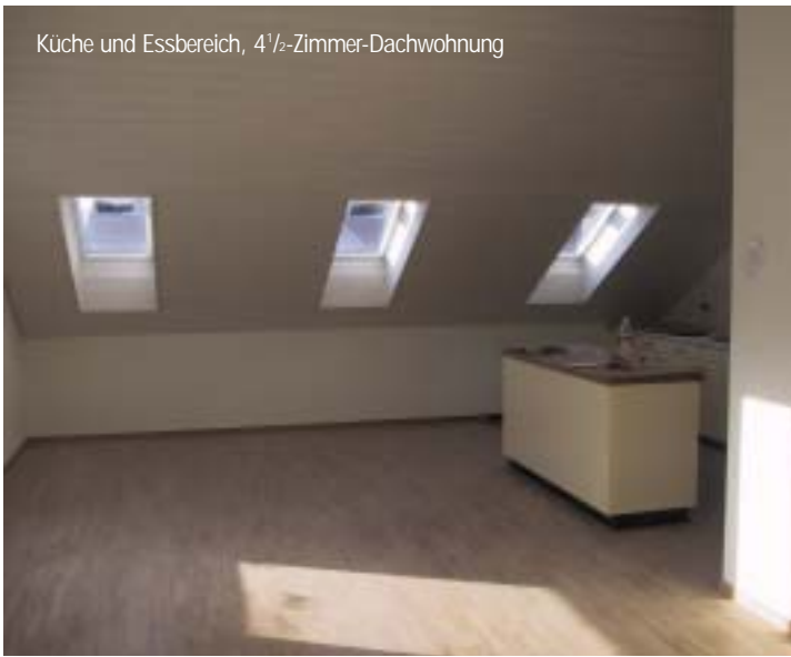
Küche und Essbereich, 4 1/2-Zimmer-Dachwohnung