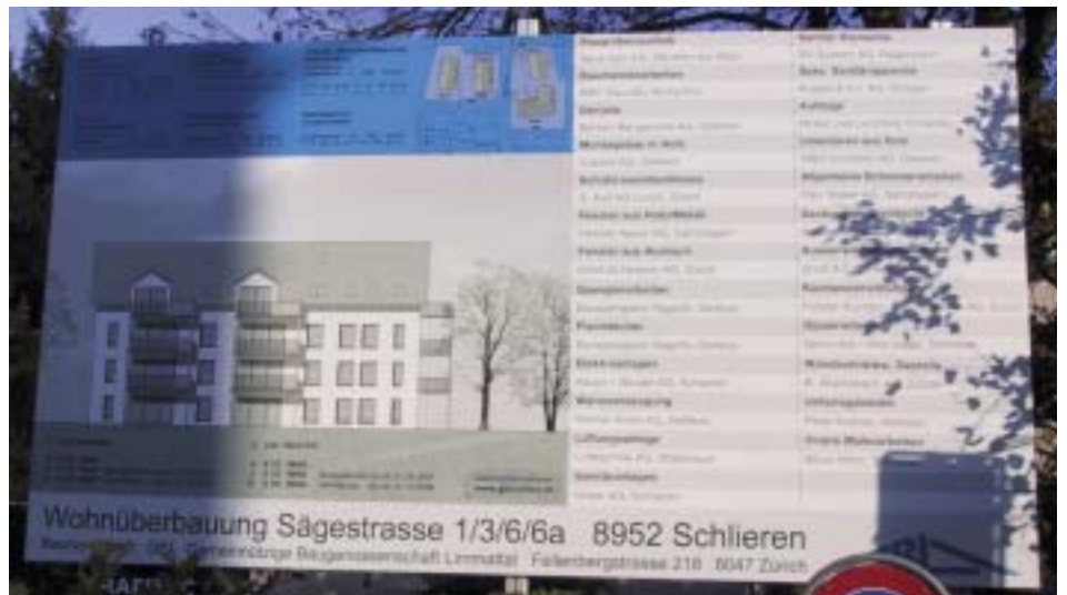
Bautafel des Projektes an der Sägestrasse

Der Abbruch der alten Häuser der 21. Etappe (Sägestrasse 1 – 3 und 5 – 7) ist ab Anfang Januar vorgesehen, damit nahtlos der Bau der Blöcke C und D der Wohnüberbauung in Angriff genommen werden kann.