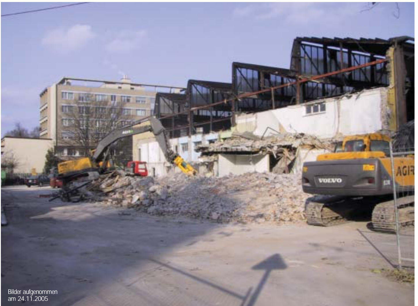
Bilder aufgenommen am 24.11.2005