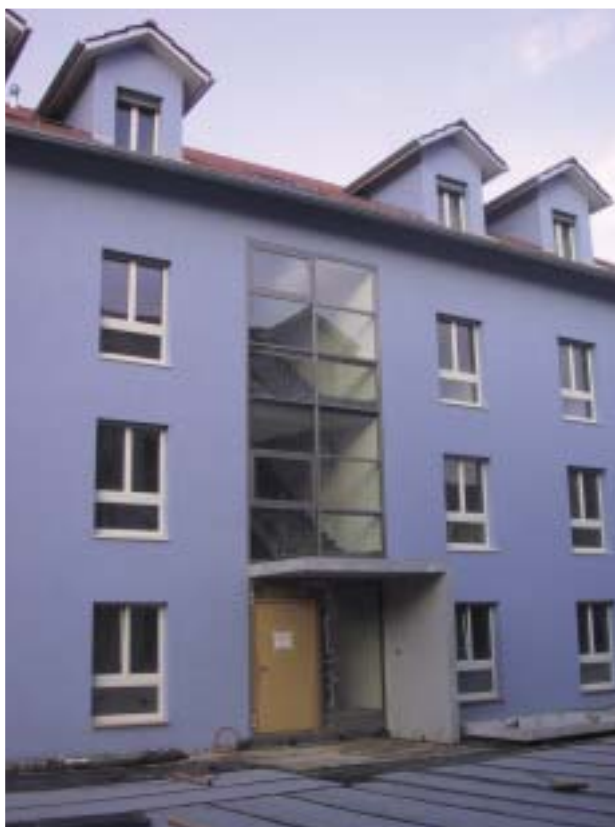
Hauseingangspartie Sägestrasse 6a (Block A); Baufortschritt am 18. November 2005