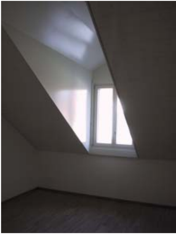
Teilansicht Kinderzimmer, Dachwohnung mit Lukarne (Lukarnenbreite vorgegeben durch baurechtliche Vorschriften der Kernzone, Liegenschaft Sägestrasse 6 und 6a)