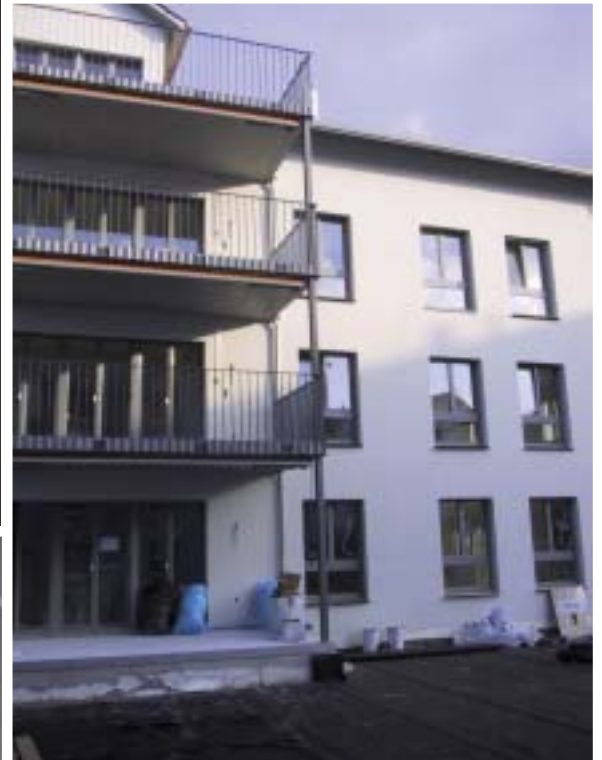
Balkonbereich Block B (Sägestrasse 6) (Stand 28.11.2005)