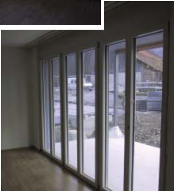
Fensterpartie Wohnzimmer/Sitzplatzausgang, 4 1/2-Zimmer-Erdgeschosswohnung