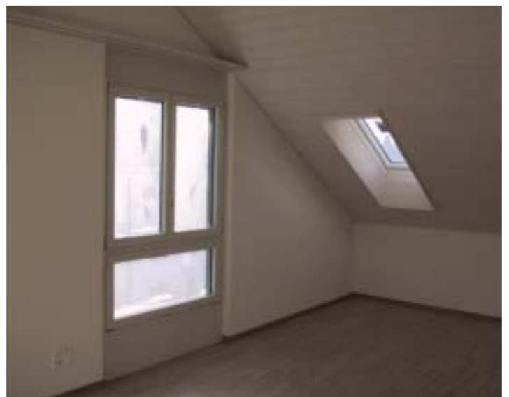
Teilansicht Schlafzimmer mit seitlichem Fenster sowie Dachflächenfenster, 5 1/2-Zimmer-Dachwohnung