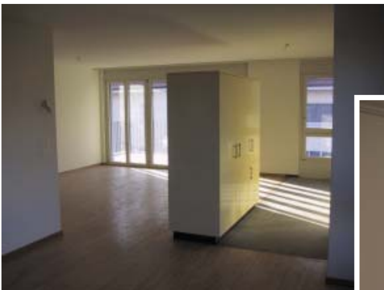
Blick vom Essbereich gegen Küche (Raumteilkorpus) und Wohnbereich mit Balkonausgang; 5 1/2-Zimmer-Etagenwohnung