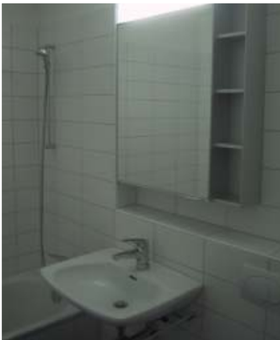
Bildausschnitt Badezimmer mit Lavabo und Spiegelschrank (Stand 30.11.2005)