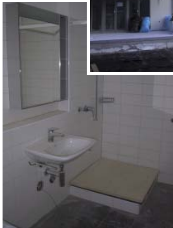
Einblick in Dusche, WC, Lavabo (Stand 28.11.2005; Bau-Endreinigung noch nicht erfolgt)