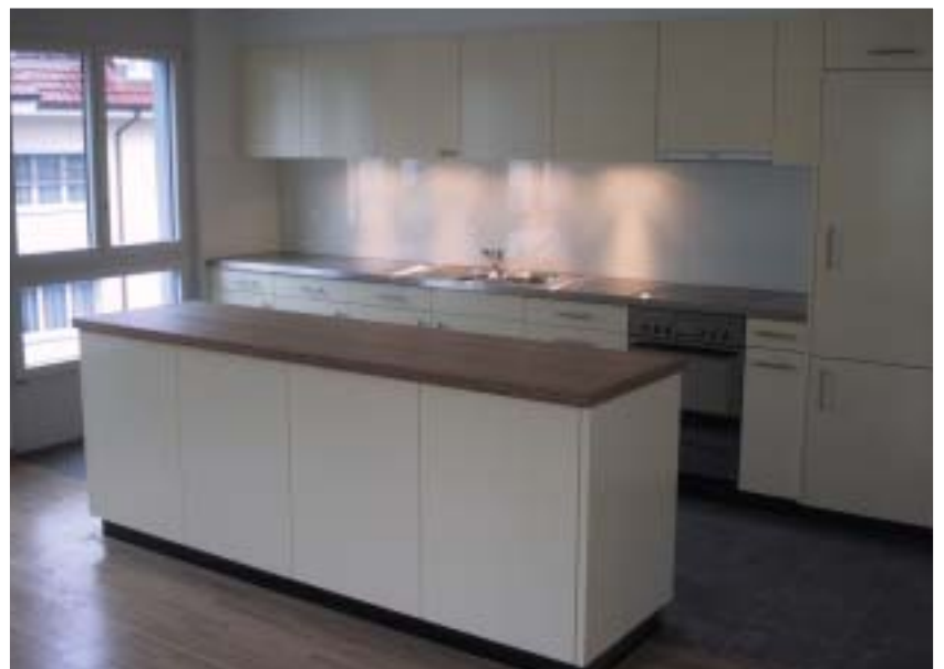
Kücheneinbauten, 4 1/2-Zimmer-Etagenwohnung