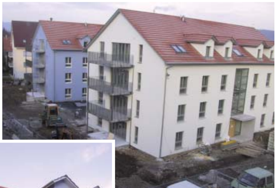
Wohnhäuser Sägestrasse 6 (Block B) und 6a (Block A); Baufortschritt am 18. November 2005